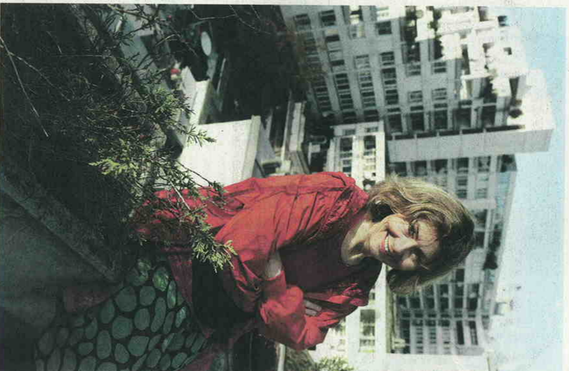
Es kommen die Alleingesessenen ebenso hin wie die „Neuen“?